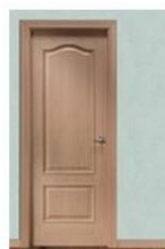
32M HAYA VAPOR