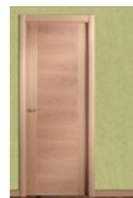
VP5 HAYA VAPOR