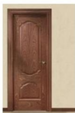
802M SAPELLY DB