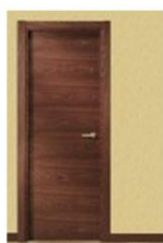
LT SAPELLY DB