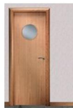
L OJO DE BUEY CEREZO