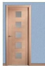
VP1-5VCB HAYA VAPOR