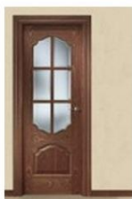
802-6VM SAPELLY DB