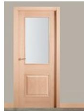
R-E-12-1VM HAYA VAPOR