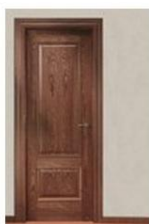
12M SAPELLY DB