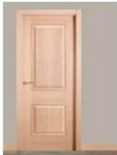
R-E-12M HAYA VAPOR