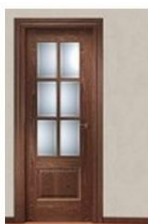
12M-6VM SAPELLY DB