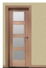
LGT-4VB-N HAYA VAPOR