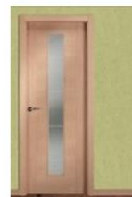
VP5-1VCB HAYA VAPOR