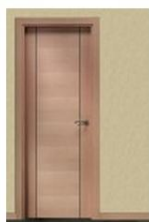
LGT-N HAYA VAPOR