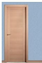
VP1 HAYA VAPOR