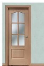
32-6VM HAYA VAPOR